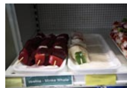
Vikvalsspett kan köpas i hamnen i Reykjavik, nära valskådningsbåtens tilläggsplats.