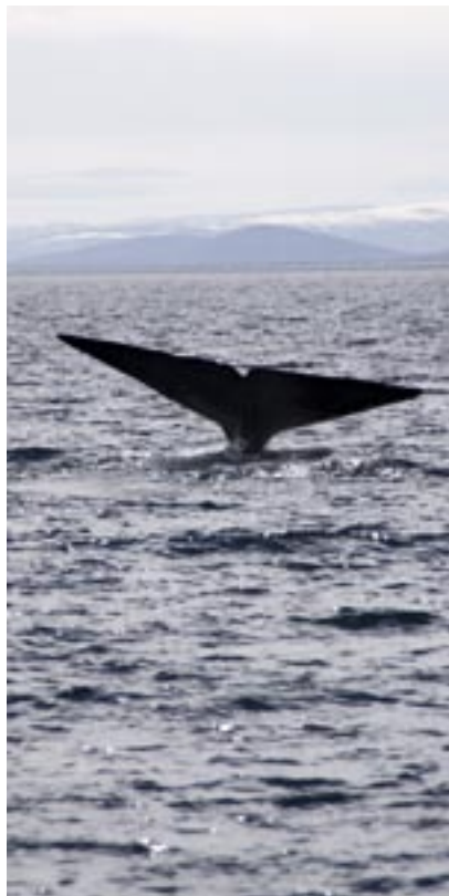
Dykande blåval i viken Skjálfaflói strax utanför Húsavik.

Nu förbereder Paul Watson sig inför ännu ett Islandsbesök. Han är en objuden gäst – som vanligt. Och fiskeriminister Gudfinnsson lovar att kustbevakningen står beredd att slänga ut både Watson och resten av