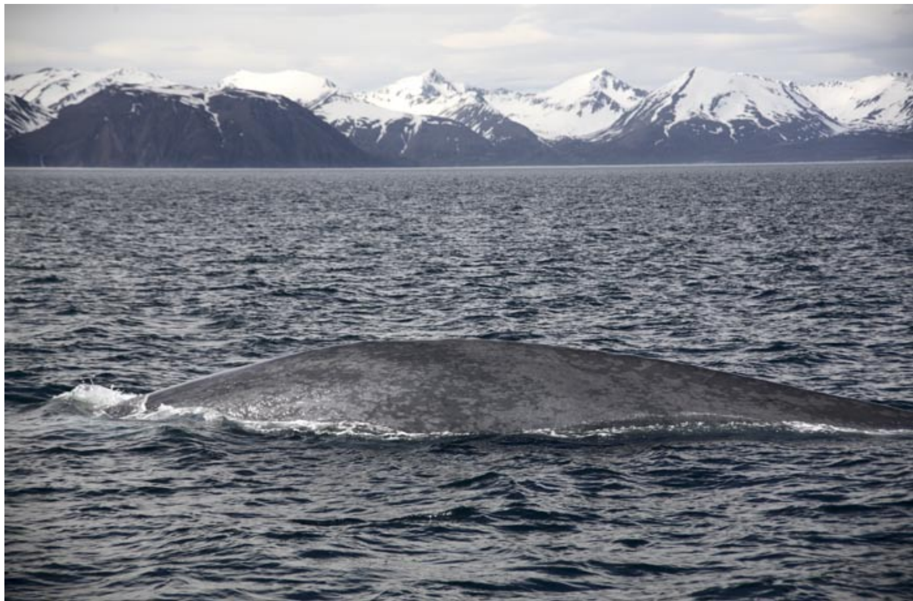
Blåval, sedd i viken Skjálfaflói strax utanför Husavik.