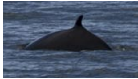
Det finns cirka 40 000 vikvalar runt Island.

Förra året återupptog Island den omstridda jakten på val. De som är för vill sälja köttet till Japan och tjäna storkovan. De som är emot tycker att jakten är onödig och ger Island dåligt rykte. Och så finns Sea Shepherd som är på väg till Island för att helt enkelt stoppa valfångarna.